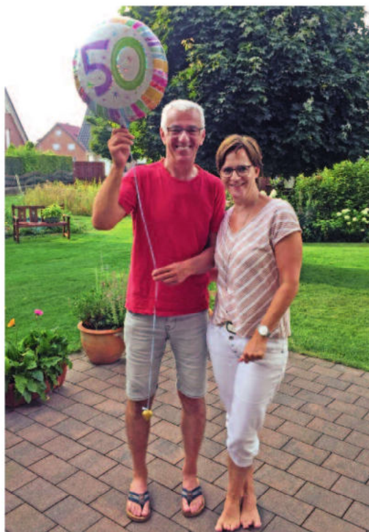
Anstelle eines privaten Geburtstagsbesuches wehten in diesem Jahr symbolisch Ballons per WhatsApp über die Grenze

Die 60 Teilnehmenden der Jugendbegegnung 2019 in Rosendahl und Berlin freuen sich schon auf die Neuauflage ihres Treffens, das statt April 2020 nun hof-