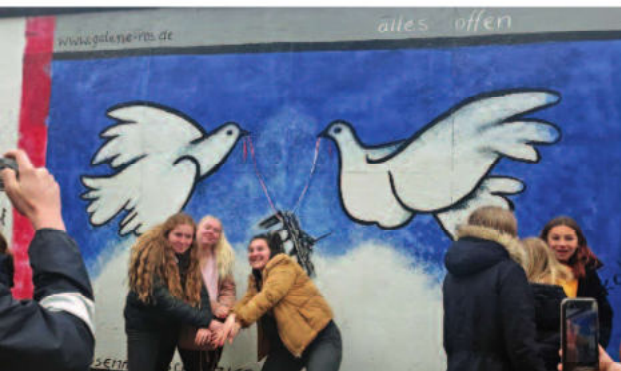
Bei der Jugendbegegnung im April 2019 in Berlin setzten sich die deutschen und französischen Jugendlichen vor der East Side Gallery für die sozialen Medien in Szene

Ebenfalls über WhatsApp und E-Mail werden Kochrezepte ausgetauscht. Besonders beliebt sind die Entrammer Moules Frites mit Sauerampfersauce. Ganze Familien setzen sich am Sonntagabend vor den Bildschirm und prostern sich mit Champagner oder Sekt zum Apéritif zu.